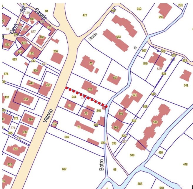
Estratto catastale – Fonte: Portale Geoscopio